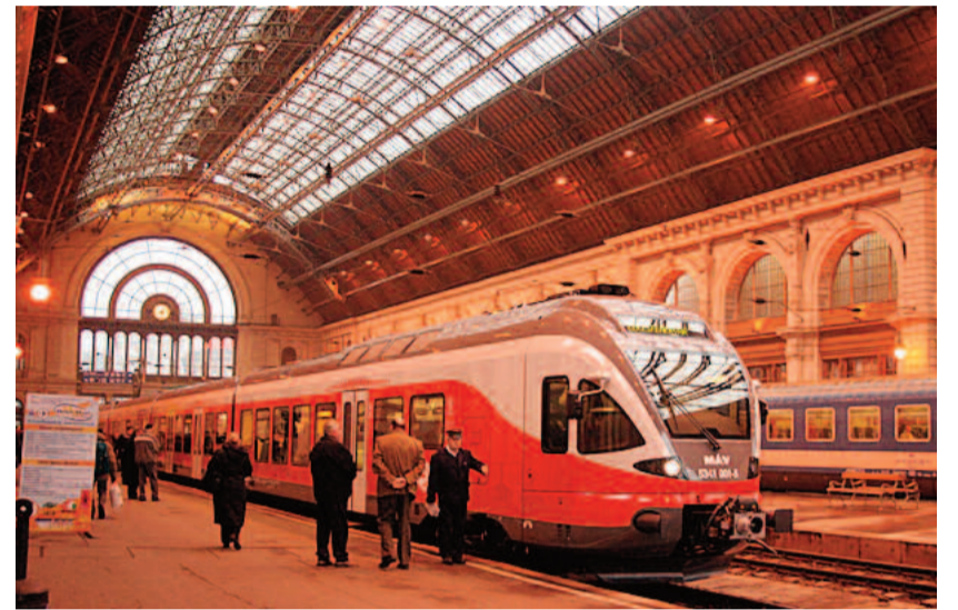
Auch die Ungarn setzen auf Regional-Triebzüge (Bild in Budapest) von Stadler.