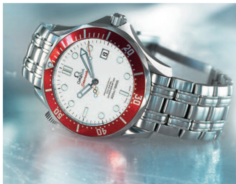
Rechtzeitig für Olympia: Die Omega Seamaster als Limited Edition Vancouver 2010

gesellschaften. Die Markenvielfalt brilliert mit: Breguet, Blancpain, Glashütte Original, Jaquet Droz, Léon Hatot, Omega, Tiffany & Co, Longines, Rado, Union