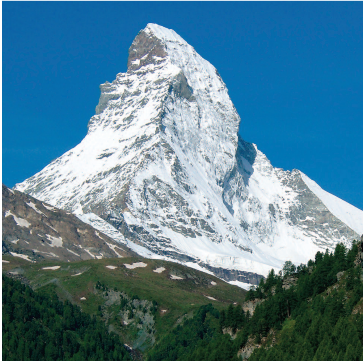
Die Schweiz hat als Identität nicht nur das Matterhorn und ein hochentwickeltes Demokratieverständnis. Die Wirtschaft kann sich auch auf erstklassige Unternehmen mit Spitzenpositionen auf den Weltmärkten stützen. Die Marke „Swiss“ steht für Solidität, Berechenbarkeit und Qualität. Der Finanzsektor spielt eine wichtige Rolle, ist aber mit einer Bruttowertschöpfung von 12 Prozent keineswegs dominierend.

Die Schweiz muss sich nicht neu erfinden, aber Land und Leute müssen natürlich mit den üblichen Klischees aus dem Ausland, insbesondere aus Deutschland, leben. Käse, Schokolade, Uhren, Berge und Seen und selbstverständlich die Banken, die sich hinter dem Bankgeheimnis versteckten – dies wäre die Schweiz. Aber schon das Bankgeheimnis ist ja ein Bankkundengeheimnis und deshalb sind alle jetzt veröffentlichten Zahlen über die Höhe der angeblichen Steu-