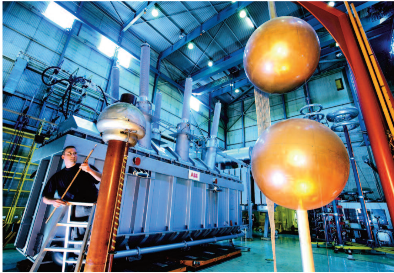
Transformatoren sorgen für die richtige Spannung der elektrischen Energie in die Übertragungsnetze.

Angesichts einer erwarteten Verdoppelung des elektrischen Energiebedarfes (schon allein aus Gründen der extremen Zunahme der Weltbevölkerung) in den nächsten 30 Jahren wird auch künftig ABB mit all seinen Geschäftsfeldern eine wichtige und zentrale Rolle spielen. Das Beispiel Desertec mag nur stellvertretend in diesem Zusammenhang erneut das Chancenpotenzial für das Unternehmen aufzeigen.