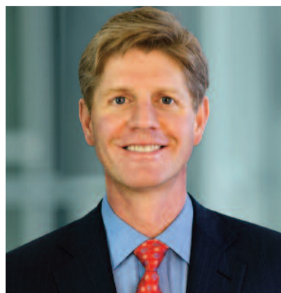
ABB-Konzernchef Joe Hogan

melden, doch lag der Auftragsbestand zum Jahresende 2009 mit 24.771 Mio. US-Dollar bereits wieder um 4% über dem entsprechenden Wert per 2008 (23.837 Mio. US-Dollar). Im Gesamtjahr 2009 erzielten die Schweizer einen Auf-