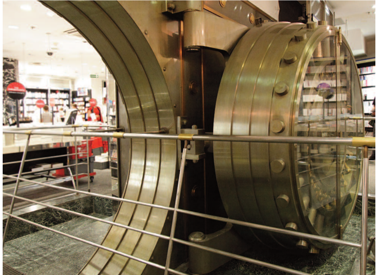
Will die EU Schweizer Tresore knacken, weil sie Geld wegen Griechenland (siehe Kommentar unten) braucht?

Nach schweizerischem Verständnis leben die Bürger nicht für den Staat. Sie sind nicht in erster Linie Steuerzahler, sondern freie Menschen. Als freie Menschen haben sie ein Recht auf Leben, Eigentum und Privatsphäre. In diesem Kontext steht das Bankgeheimnis. Das Bankgeheimnis schützt die finanzielle Privatsphäre der Bürgerinnen und Bürger vor unberechtigten Einblicken anderer Privatpersonen oder auch des Staates. Das Bankgeheimnis schützt jedoch keine strafbaren Handlungen – weder von Schweizern noch von Ausländern. Bei qualifizierten Hinweisen kann das Bankgeheimnis aufgehoben werden. Die Schweiz ist bereit, den Artikel 26 des OECD-Musterabkommens zur Amtshilfe bei Steuerdelikten zu übernehmen. Damit ist auf Antrag und im konkreten Einzelfall der Informationsaustausch auch bei Steuerhinterziehung möglich. Was die Bekämpfung von Betrug, Korruption und Geldwäscherei sowie die