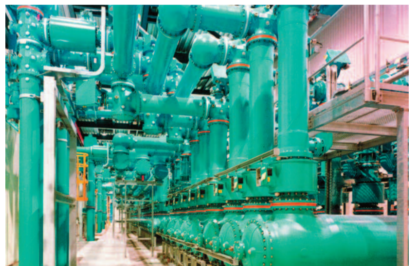
ABB-Gasisolierte Schaltanlagen (GIS) sichern die stabile Stromversorgung.

um 6% auf CHF 0,51 je Aktie vor. In Deutschland gehört die von Mannheim aus gesteuerte Landesgesellschaft ABB Deutschland mit ca. 10.000 Mitarbeitern, die einen Umsatz von ca. 3,7 Mrd. Euro erwirtschaften, zu den traditionsreichsten Gesellschaften des gesamten ABB-Konzerns. Und im benachbarten Heidelberg befindet sich die renommierte ABB STOTZ-Kontakt GmbH mit Produkten der Schalt- und Steuerungstechnik als Gesellschaft der ABB Deutschland, die wiederum zu 100% zum ABB-Konzern in Zürich gehört.