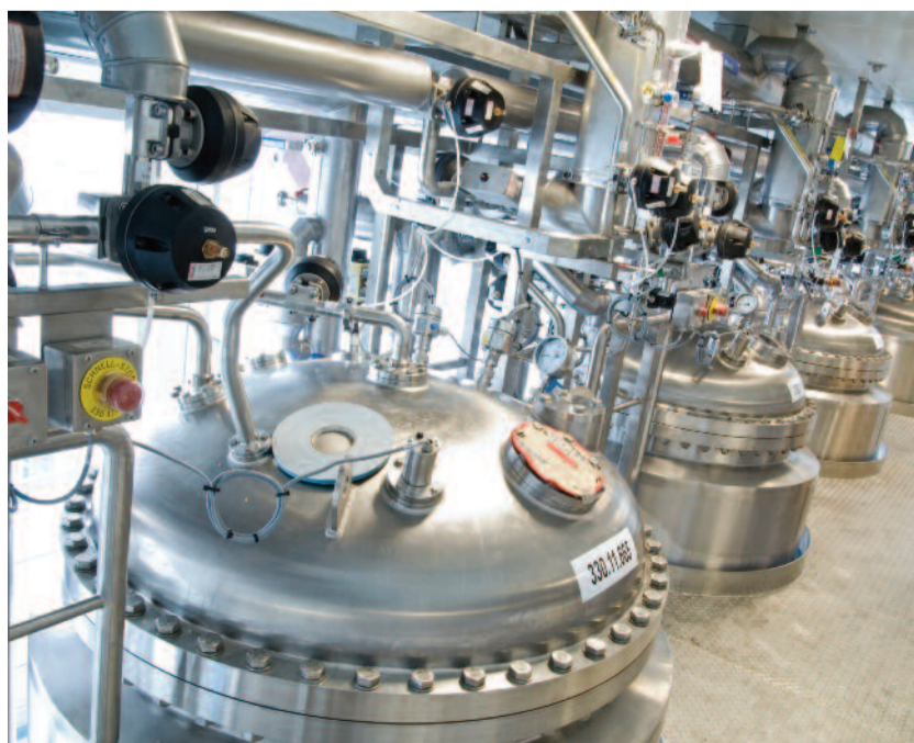
Der Schweizer Pharmariese Roche gehört weltweit zu den erfolgreichsten Unternehmen der Branche. Im Bild eine Biotechnologie Anlage in Basel.

Schweizer Unternehmen sind vor allem außerhalb des Landes bedeutende Arbeitgeber. Bereits vor 10 Jahren beschäftigte die Wirtschaft der Schweiz im Ausland 1,65 Millionen Personen. Insbesondere in Deutschland sind die Unternehmen aus unserem Nachbarland (Nestlé, Roche, Novartis, ABB und viele andere) sichere Investoren und Arbeitgeber. Nach einer amerikanischen Studie von „Foreign Policy“ gehört die Schweiz zu den am meisten globalisierten Ländern insbesondere bei den Faktoren Außenhandel und Investitionen im Ausland. Umgekehrt haben viele deutsche Großunternehmen die Standortvorteile der Schweiz erkannt. Der führende Logistikkonzern Kühne + Nagel sowie die Liebherr-Gruppe werden z.B. aus der Schweiz geführt. Alles in allem wird eindrucksvoll unterstrichen, dass das Erfolgsmodell Schweiz nach wie vor aktuell ist. Es besteht kein Grund dafür, dass sich das Land neu erfinden muss. Im Gegenteil. Mit ihrer Basisdemokratie der direkten Volksentscheide bei wichtigen Fragen ist die Schweiz Vorbild. Die derzeitige Häme gegen das Land ist nicht geeignet, eine europafreundlichere Haltung einzunehmen, schon überhaupt nicht vor dem Hintergrund, dass einige Länder der EU am Staatsbankrott vorbeischlittern.