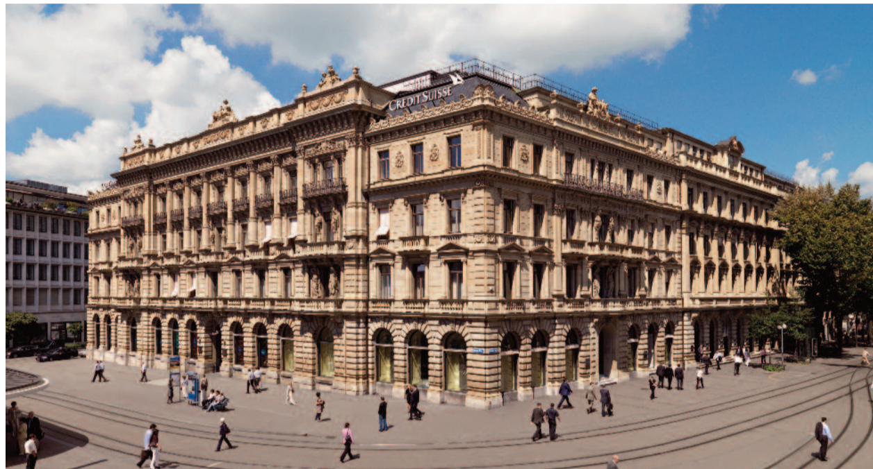
Der Finanzplatz Schweiz (unser Bild zeigt die Zentrale der Credit Suisse in Zürich) muss sich derzeit vieler unqualifizierter Angriffe aus Deutschland erwehren.

Wir erleben derzeit in bestimmten Medien und in Fernsehsendungen wie Hart aber Fair, Anne Will, Münchner Runde und anderen ein beispielloses Ausspielen der Bürger. Hier die bösen „Reichen“, die den Staat betrügen, und dort die „kleinen Leute“, die nicht die Möglichkeiten der „Reichen“ haben. Wohlhabende Bürger werden unerschwerlich diskriminiert und kriminalisiert und getan wird so, als ob die „Steuergauner“ grundsätzlich die Reichen wären. Mit Verlaub: Mit einem derartigen durch-