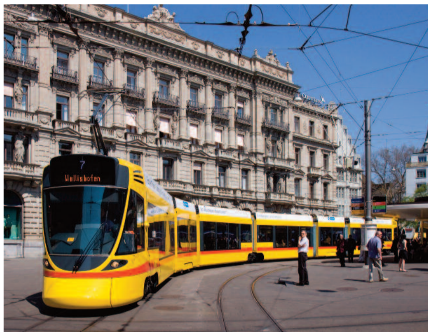
Die futuristische Straßenbahn „Tango“ von Stadler in Zürich am Paradeplatz.

der Stadler Pankow GmbH übernommen. Mit Stadler Pankow verfügt die Gesamtgruppe über ein hervorragendes Standbein für den wichtigen deutschen Markt. Gleichzeitig ist der Standort für den weltweiten Export der Straßenbahnen zuständig. Schließlich ist Pankow das Kompetenzzentrum für das Produkt Regio-Shuttle RS1.