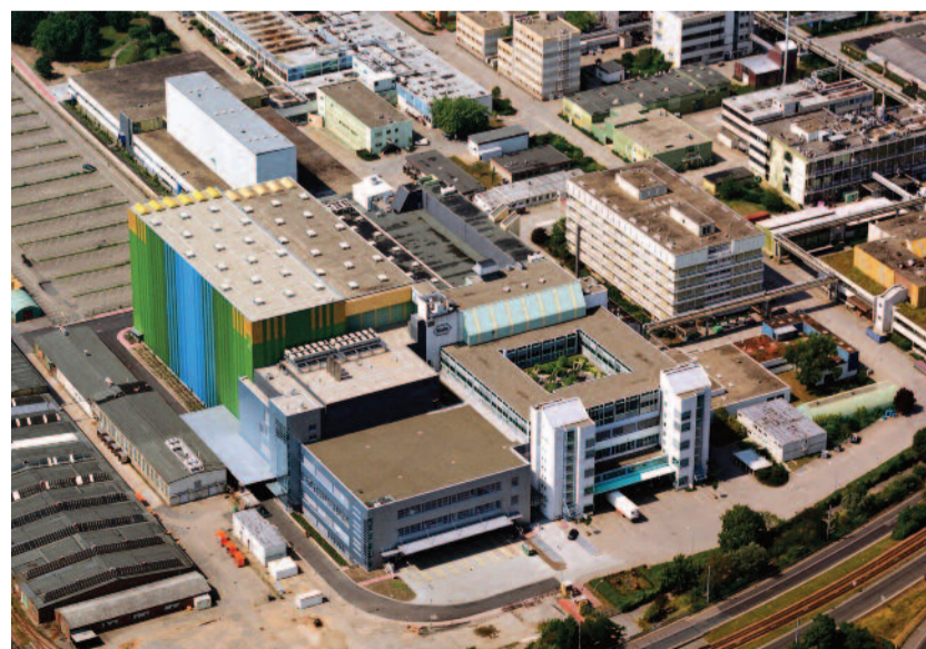
Mannheim (Bild) ist weltweit der zweitgrößte Roche-Standort.

nahme durch Roche wurde Mannheim durch ein gewaltiges Investitionsprogramm enorm aufgewertet. Jetzt fiel wieder eine wichtige Investitions-Entscheidung für den Bau einer neuen Pro-