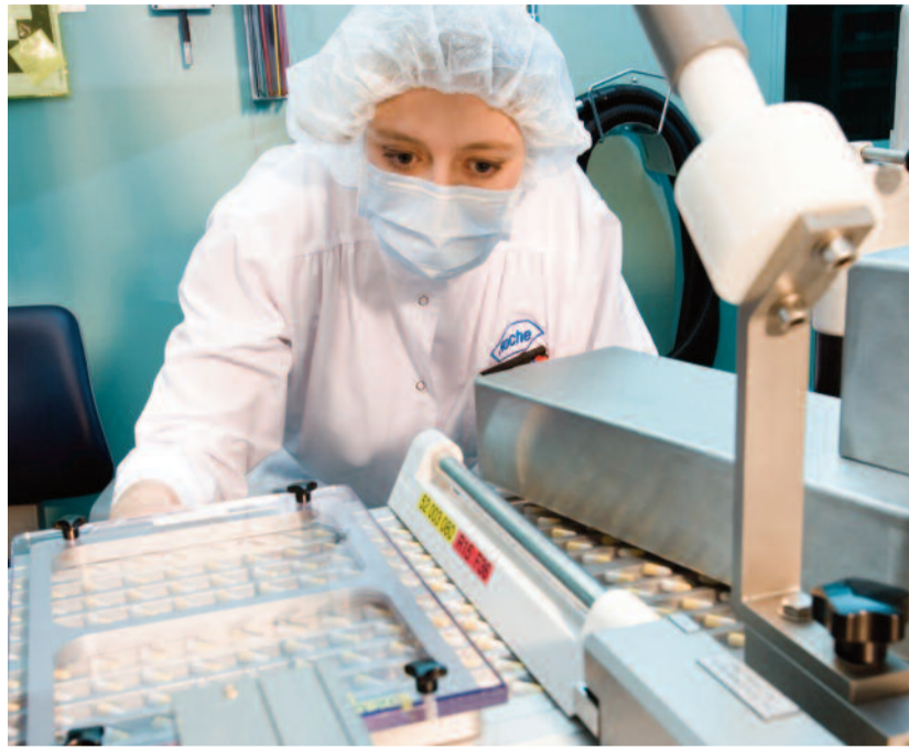
Das Roche-Grippemittel Tamiflu (Bild zeigt Verpackungsstraße in Kaiseraugst) war im Geschäftsjahr 2009 infolge einer Epidemie ein gesuchtes Präparat.