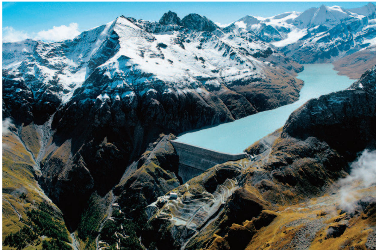
Umweltfreundliche Stromerzeugung: Das gigantische Wasserkraftwerk Grande Dixence im Wallis.

Die Schweiz ist gewillt, auch künftig auf stabile Fundamente zu setzen. In diesem Zusammenhang spielt die Finanzwirtschaft die bekannte und wichtige Rolle.