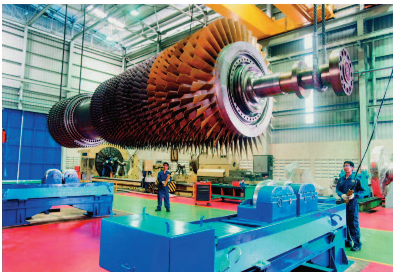
Überarbeitung des Rotors einer großen Gasturbine zur Erhöhung der Energieeffizienz für ein Kombi-Kraftwerk.