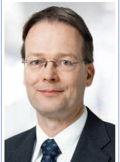
Sulzer Konzernchef, Ton Büchner setzt auf innovative Märkte.