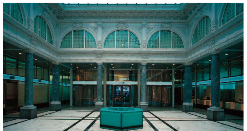
Das besondere Flair des Finanzplatzes Schweiz muss erhalten bleiben.