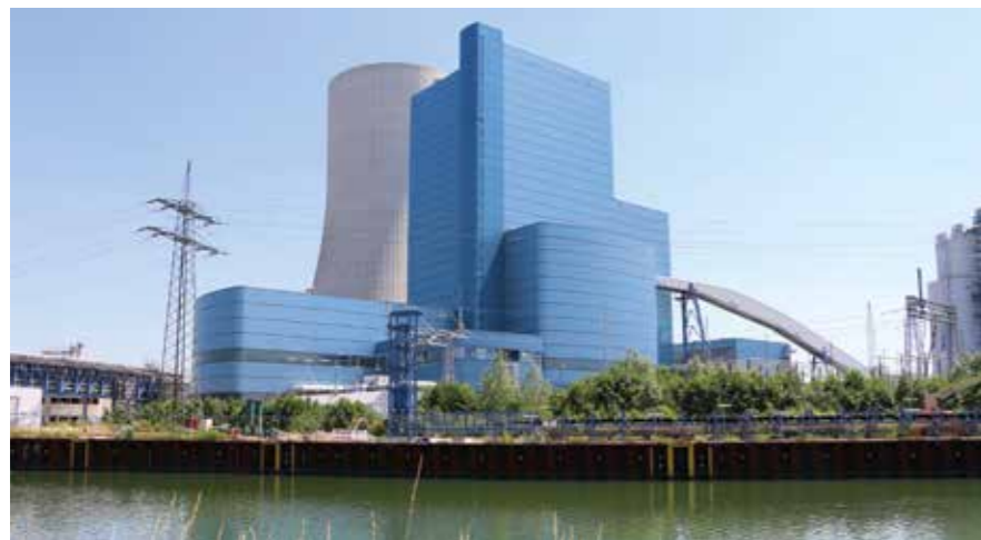
Moderne und umweltfreundliche konventionelle Kraftwerke wie Datteln IV werden auch künftig für die Absicherung der Energiewende benötigt.

Es kann daher der Öffentlichkeit und Politik nicht gleichgültig sein, wer die Kontrolle bei Uniper einnimmt. Deutschland hat in der jüngeren Energiegeschichte nicht immer gute Erfahrungen mit ausländischen Investoren auch aus der Energiewirtschaft gemacht. 2010 kaufte das Land Baden-Württemberg die vom französischen