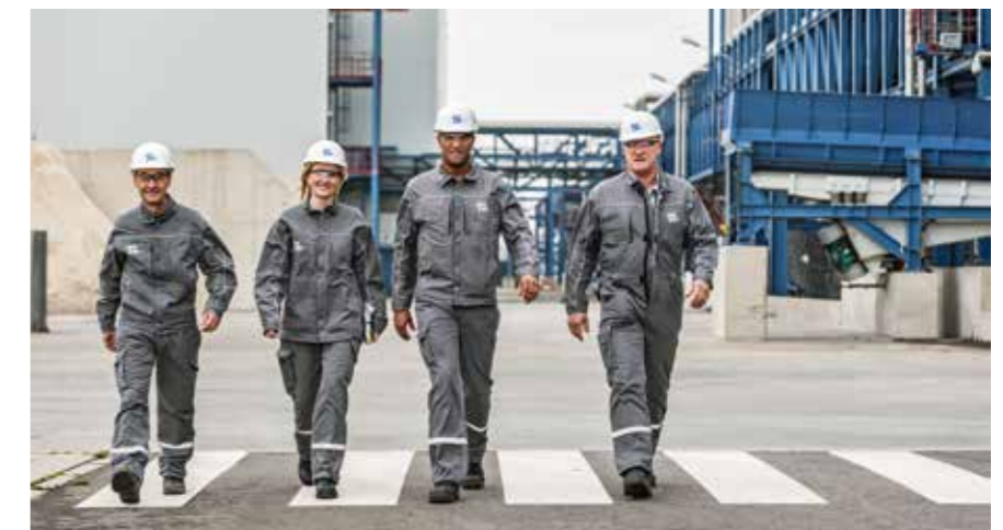
Kompetente und motivierte Mitarbeiter tragen zum Uniper-Erfolg bei.

Unternehmen der Energiewirtschaft sind immer auch Wegbereiter für Standortqualitäten. Das Umfeld der Energie prägt die Gesellschaft und Umwelt. Dabei darf aber nicht vergessen werden, dass eine moderne und leistungsfähige Strom- und Gasversorgung ein mit ausschlaggebender Schlüsselfaktor für den wirtschaftlichen und technischen Fortschritt eines Landes wie Deutschland ist. Diesen Grundsätzen sieht sich die Uniper SE durch ihre Verantwortung für ihre Beschäftigten und die gesamte Gesellschaft verpflichtet.