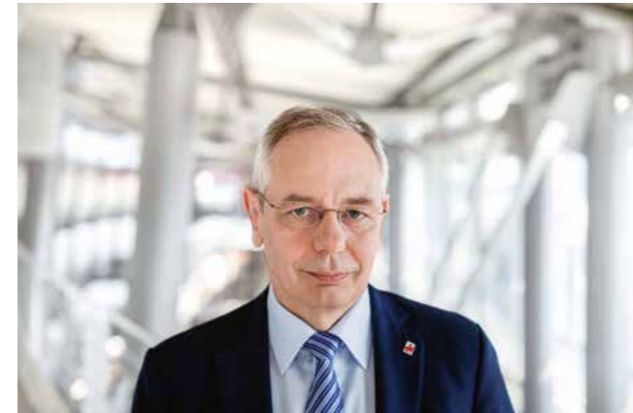
IG-BCE-Vorsitzender Michael Vassiliadis weist auf die sozialen und wirtschaftlichen Folgen für die Menschen bei einem Ausstieg aus der Kohle hin.

Gefordert wird heute insbesondere durch die Grünen – aber auch durch andere fundamentalistisch interessierte Kreise – der komplette Ausstieg aus der Kohle. Dieser soll offensichtlich möglichst rasch und unrealistisch erfolgen, obwohl immer noch nicht eine funktionierende Alternative zur konventionellen Stromerzeugung für eine jederzeit gesicherte und unterbrechungsfreie Stromversorgung, insbesondere nach dem Abschalten der letzten KKW-Anlage, erkennbar ist. Wieder wird einmal die Energiewirtschaft und insbesondere die Stromerzeugung zum politischen Spielball. Ausgespielt wird die Kohle und die damit verbundene Stromerzeugung mit dem Klimaschutz, obwohl nach wie vor „die offene Frage, ob mit einseitigen nationalen Ausstiegen überhaupt effektive Beiträge zum weltweiten Klimaschutz und zur Senkung der europäischen CO 2 -Emissionen geleistet werden“, besteht, wie so zutreffend Michael Vassiliadis, Vorsitzender der IG