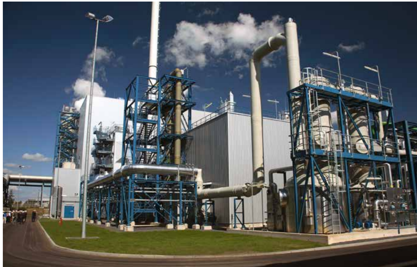
Der inzwischen stillgelegten CCS-Versuchsanlage einer weitgehenden CO 2 -Abscheidung am Kraftwerkstandort Schwarze Pumpe fehlten Akzeptanz und politische Rahmenbedingungen.