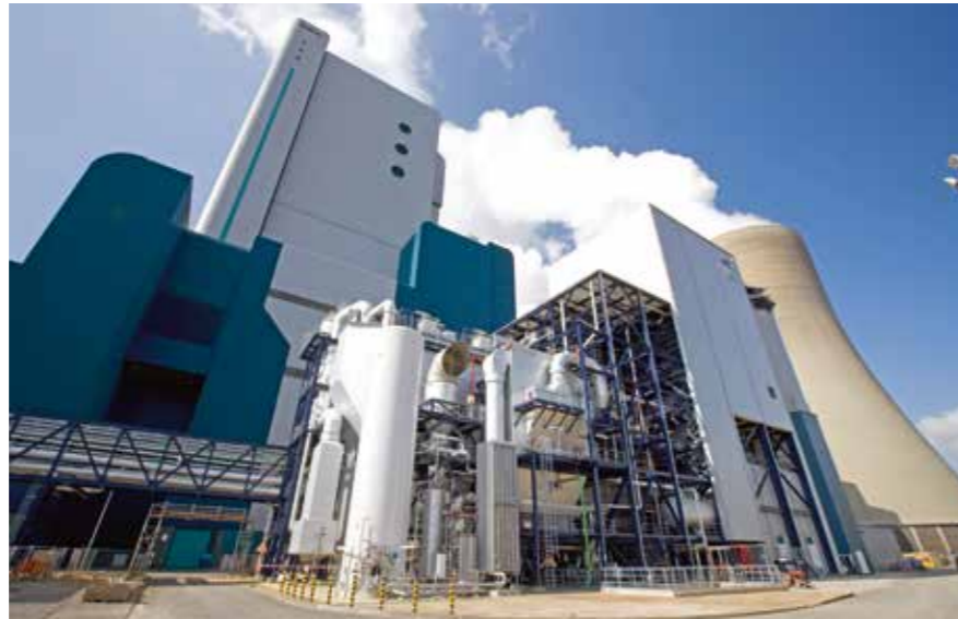
2002 war der westlich von Köln liegende RWE-Standort Niederaußem mit dem neuen Block BoA (Optimierte Anlagentechnik) das weltweit modernste Braunkohlekraftwerk der Welt.