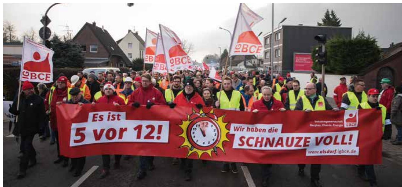
Mehr Respekt und Perspektiven für Arbeit – dies war die Devise einer Großdemonstration der Beschäftigten der rheinischen Braunkohleindustrie inklusive der Kohlekraftwerke sowie der energieintensiven Unternehmen.