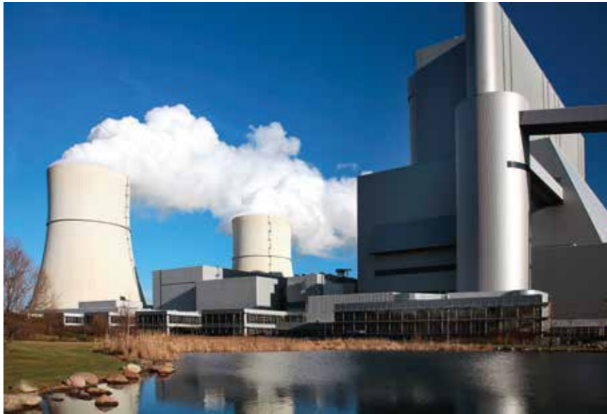
Das Kraftwerk „Schwarze Pumpe“ (Spremberg) wurde 1998 in Betrieb genommen. Das Projekt gehörte nach der Wiedervereinigung zu den Großinvestitionen in Mitteldeutschland.