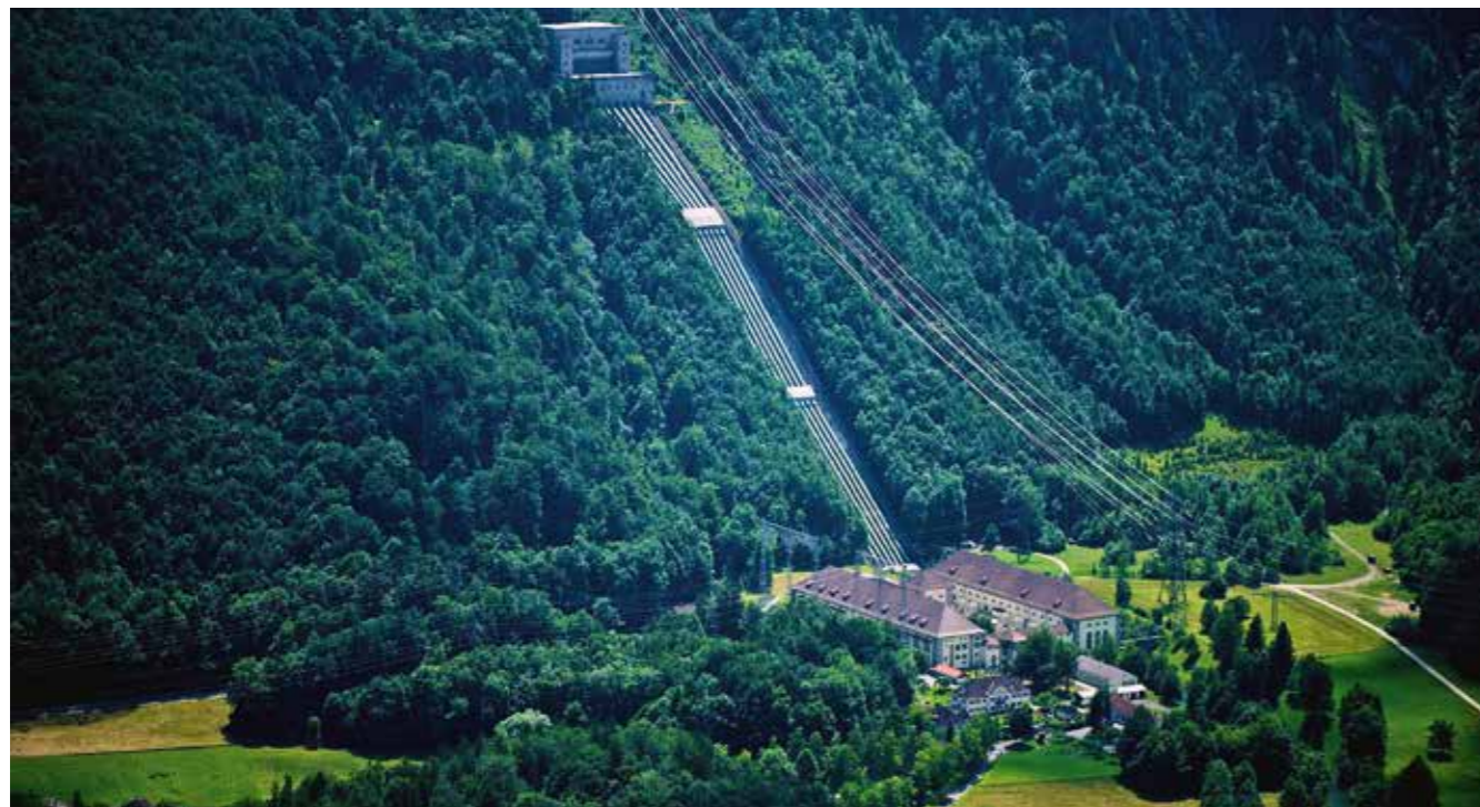
Das Walchenseekraftwerk hat nicht nur Bayerns Energiegeschichte geprägt. Heute ist es als Beispiel der Industriekultur mit dem „Wasserschloss“ und den mächtigen Druckrohren ein weithin erkennbares Markenzeichen. Immer noch ist das Walchenseekraftwerk eines der größten Hochdruckspeicherwerke in Deutschland.