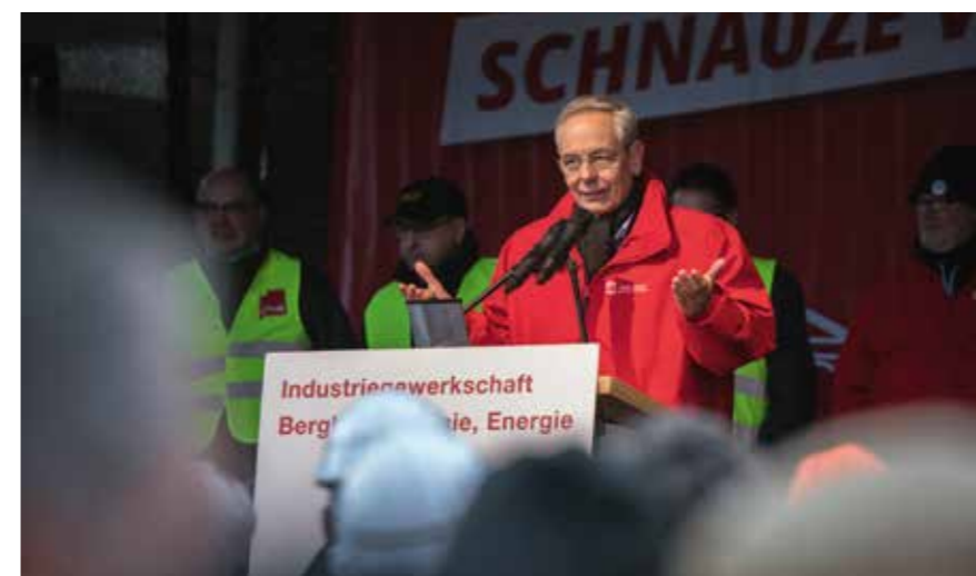
IG BCE-Chef Michael Vassiliadis forderte mehr Realitätssinn in der Energiepolitik und kein Einknicken vor geschürten Emotionen. Realistische Einschätzungen in Energiefragen fänden kaum noch Gehör, beklagte er vor den zahlreichen Demonstranten.

Scharf kritisierte Vassiliadis auch die derzeitigen Debatten um ein voreiliges Abschalten konventioneller Kraftwerke, wie sie im Rahmen der Regierungsbildung in Berlin hochgekommen sind. Statt eine realistische Politik zu betreiben, würden Emotionen geschürt. „Da werden Glaubenskriege in die Gesellschaft getragen“, sagte er weiter. Die Ziele in der Klimapolitik würden immer ehrgeiziger, Argumente und realistische Einschätzungen fänden hingegen kein Gehör. Nach dem Scheitern der Sondierungen zu einer Jamaika-Koalition forderte der Gewerkschaftschef nun von SPD und Uni-