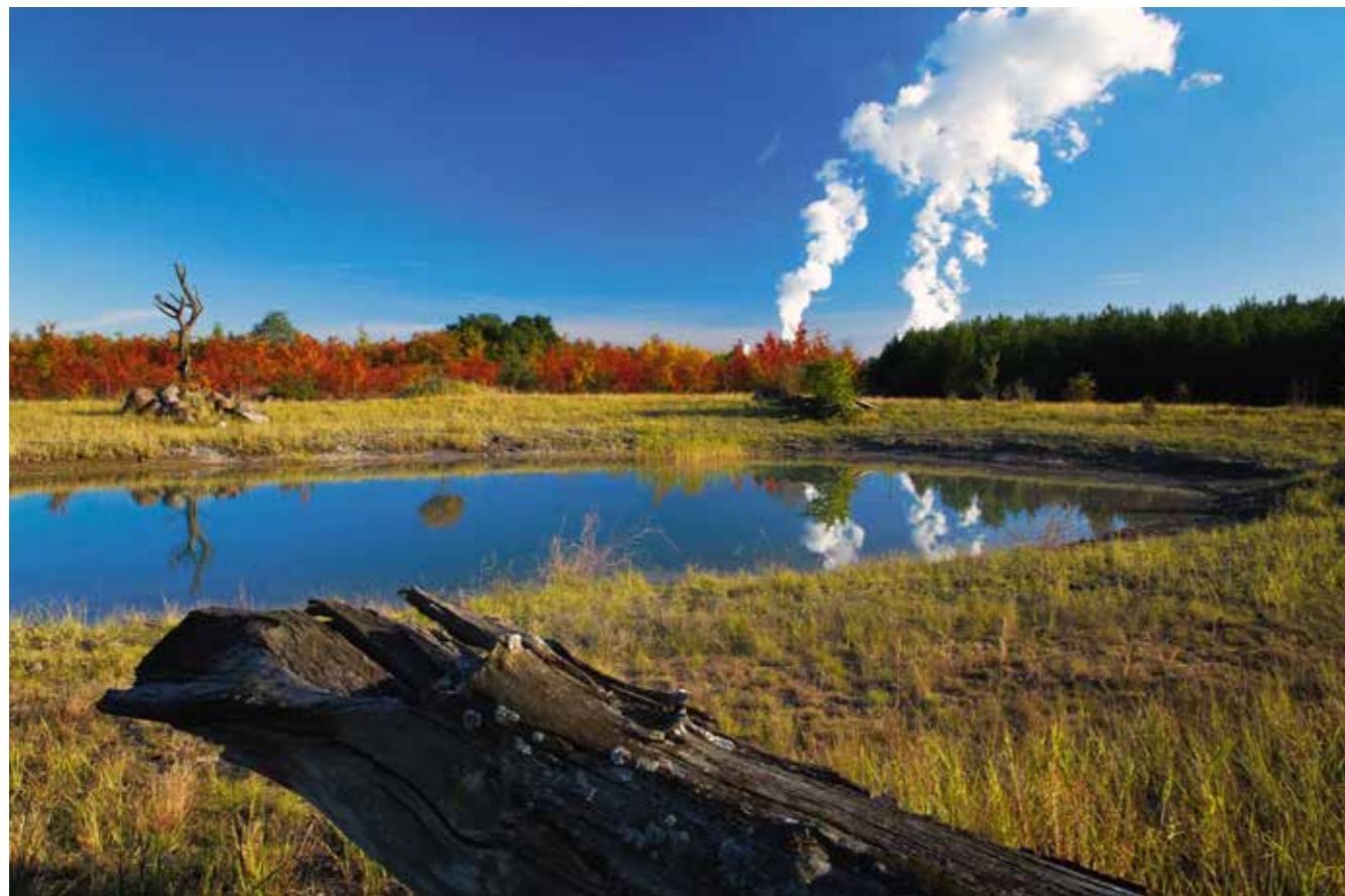
Vorbildliche Rekultivierung in Nochten im Landkreis Görlitz. Tagebaue werden Erholungslandschaften.

Bergbau, Chemie, Energie in einem Brief vom 15.11.2017 u.a. an die Bundeskanzlerin ausführte.