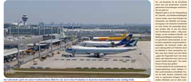
Der Luftverkehr spielt eine wichtige Rolle für die deutsche Wirtschaft.