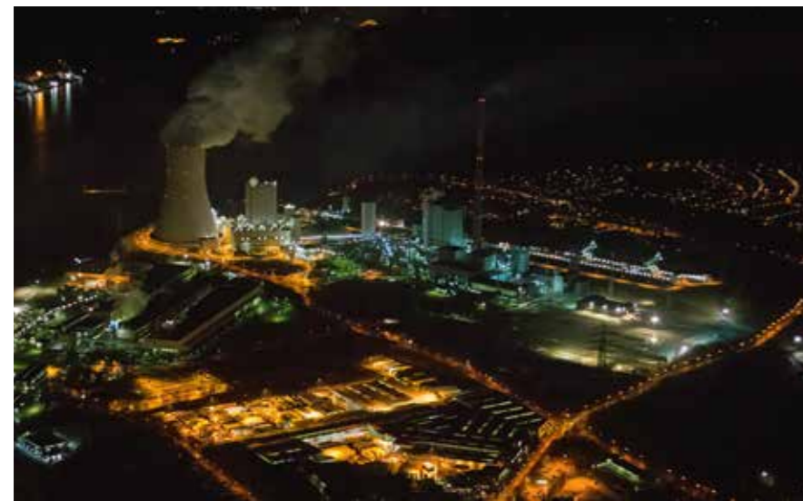
Das Steag-Steinkohlekraftwerk Duisburg-Walsum erzeugt mit modernster Technik Strom, Fernwärme und Prozessdampf für die Industrie.

Die Angst vor der in zahlreichen Medien beschworenen Apokalypse ist traditionell bei