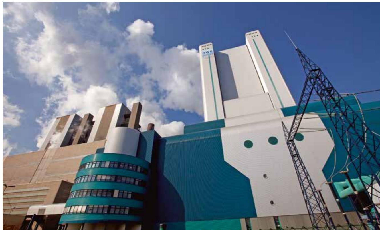
Die CO 2 -Pilotwäsche wurde beim BoA-Braunkohlenkraftwerksblock Niederaußem – Bild – angeschlossen, um die innovative Verfahrenstechnik praxisgerecht im Dauerbetrieb erproben zu können.

N och ist der Durchbruch für den großtechnischen Einsatz nicht ganz geschafft, aber das Ziel, z.B. CO 2 , das bei der Verstromung von Braunkohle entsteht, weitgehend zu neutralisieren, ist zum Greifen nahe! Es geht um ein Verfahren, bei dessen Anwendung CO 2 erst gar nicht die Atmosphäre belastet, weil es vorher durch eine sogenannte CO 2 -Wäsche abgetrennt wird und eine stoffliche Nutzung etwa als Rohstoff für die Herstellung von emissionsarmen Treibstoffen oder für andere industrielle Produkte wie Kunststoffe ermöglicht.