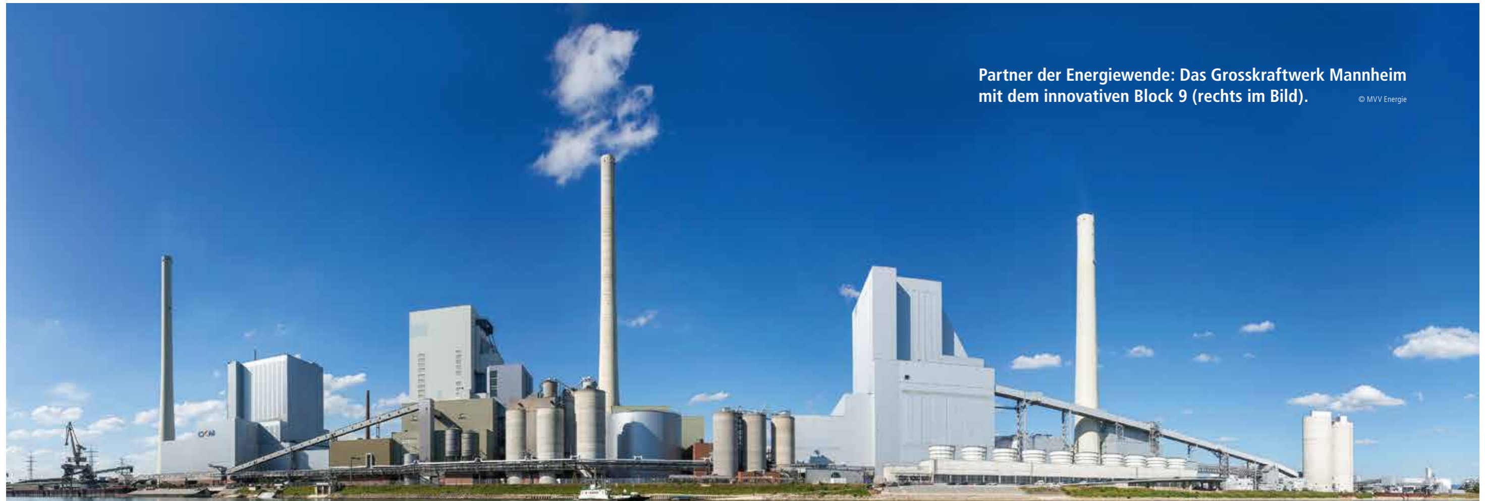
Partner der Energiewende: Das Grosskraftwerk Mannheim mit dem innovativen Block 9 (rechts im Bild).