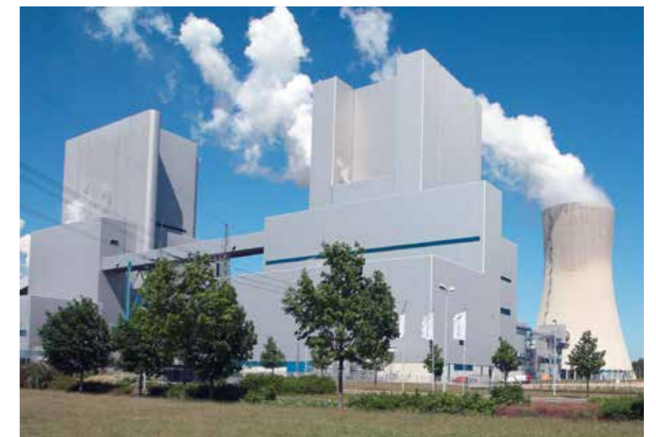
Im LEAG-Standort Boxberg in der Oberlausitz – zu DDR-Zeiten größtes Braunkohlekraftwerk – befindet sich heute mit dem 2012 in Betrieb genommenen Block R modernste Kraftwerkstechnik. Die Altanlagen wurden stillgelegt. Immer noch gehört Boxberg mit 2575 MW zu den Säulen der Stromerzeugung. Gleichzeitig liefert das Kraftwerk Fernwärme für die Stadt Weißwasser und die Gemeinde Boxberg.

Mit dem neuen Block 9 ist das Grosskraftwerk Mannheim mit insgesamt 2.146 MW das größte deutsche Steinkohlekraftwerk Deutschlands. Im Gegensatz zu Datteln IV ging der Neubau des Blocks 9, von kleineren üblichen Protestaktionen abgesehen, relativ geräuschlos über die Bühne. Dies ist für ein Großprojekt mit einer Investitionssumme von 1,2 Mrd. Euro bemerkenswert.