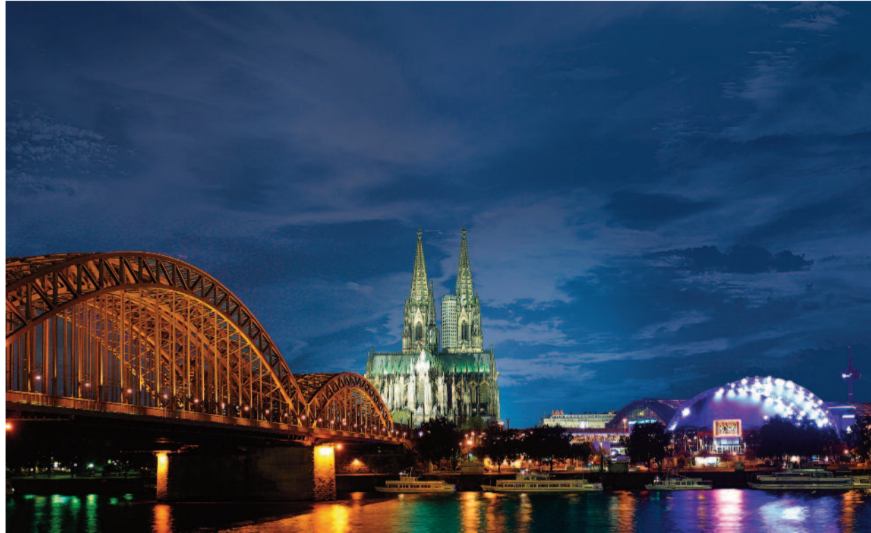
Köln: Unverwechselbares und beeindruckendes Flair einer Weltstadt; nun mit einer Niederlassung der Fürst Fugger Privatbank.

Die Fürst Fugger Privatbank ist ganz bewusst die etwas andere Bank – keine Bank wie jede andere. Der Name Fugger ist ein Synonym für Geld und Jakob Fugger, dem man auch den Beinamen „Der Reiche“ gab, wurde vor